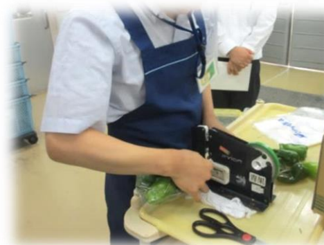
(スーパー:生鮮品の包装作業)

本校では経験できない職種を、企業の協力のもと利用者の希望に沿って職場体験をします。