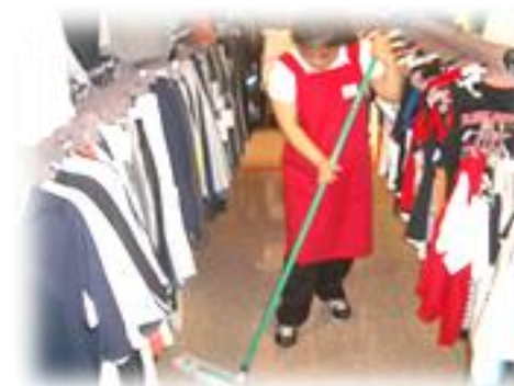
(衣料品店:品出し・清掃作業)