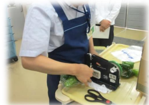
(スーパー:生鮮品の包装作)

本校では経験できない職種を、企業の協力のもと利用者の希望に沿って職場体験をします。