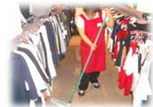
(衣料品店:品出し・清掃作業)