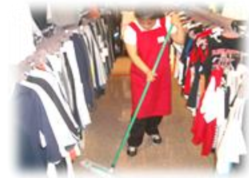
(衣料品店:品出し・清掃作業)