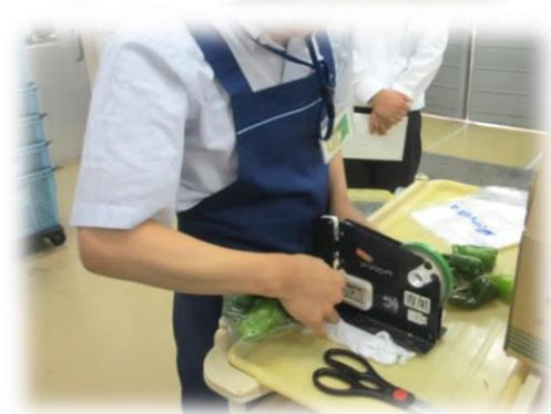
(スーパー:生鮮品の包装作業)

本校では経験できない職種を、企業の協力のもと利用者の希望に沿って職場体験をします。