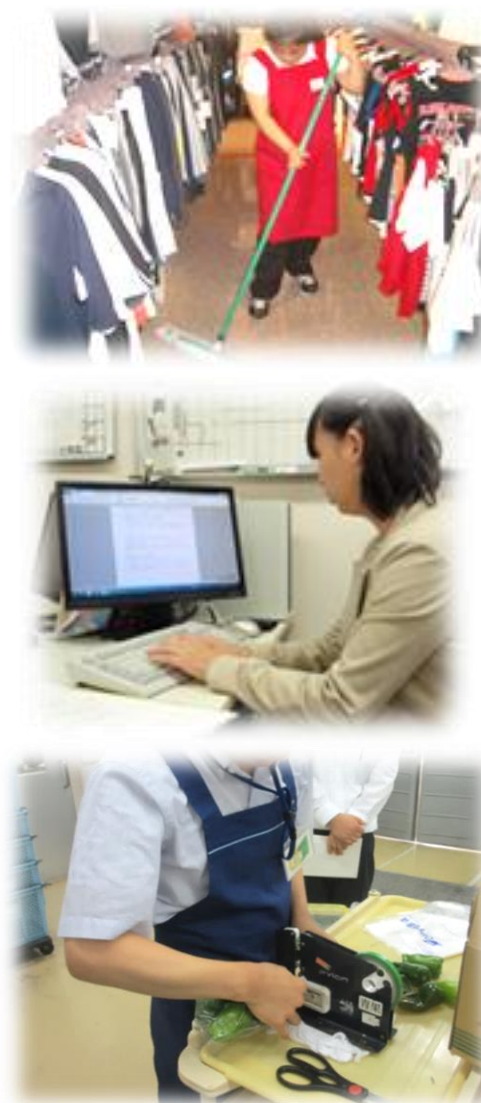
衣料品店:品出し・清掃作業