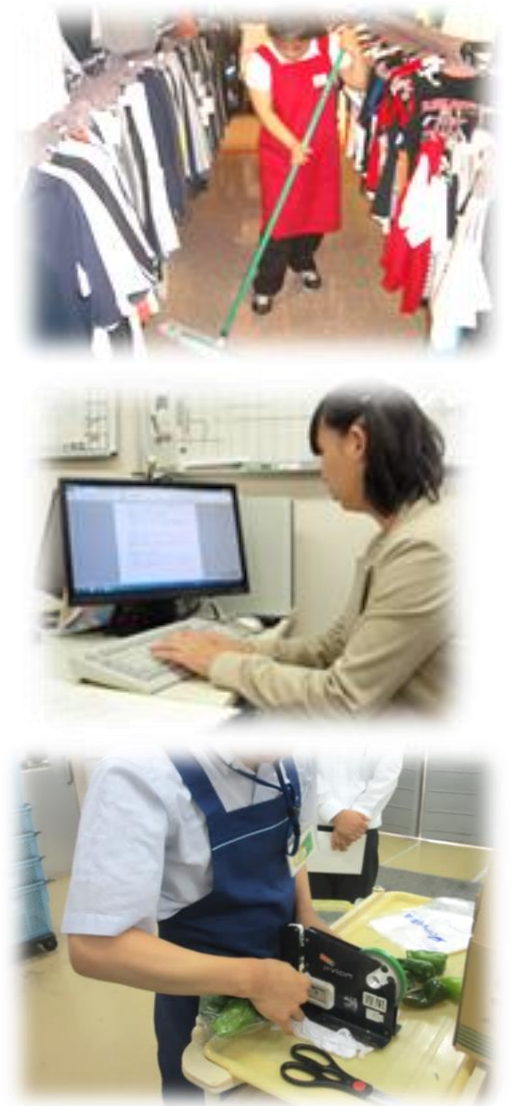
衣料品店:品出し・清掃作業