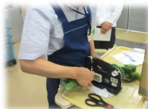
スーパー:生鮮品の包装作業

本校では経験できない職種を、企業の協力のもと利用者の希望に沿って職場体験をします。