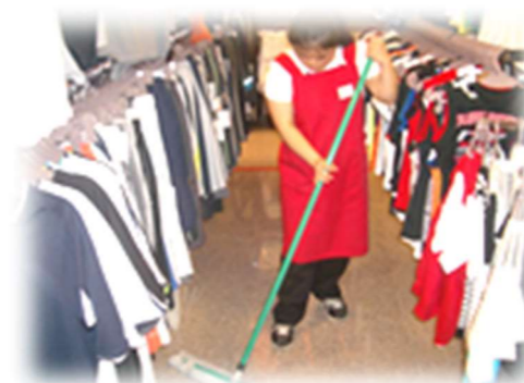
衣料品店:品出し・清掃作業